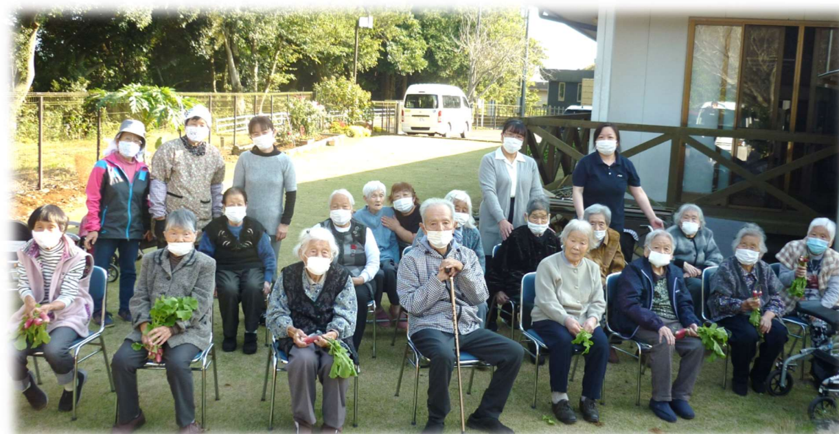
収穫の秋！あゆみの畑でかぶをとりました