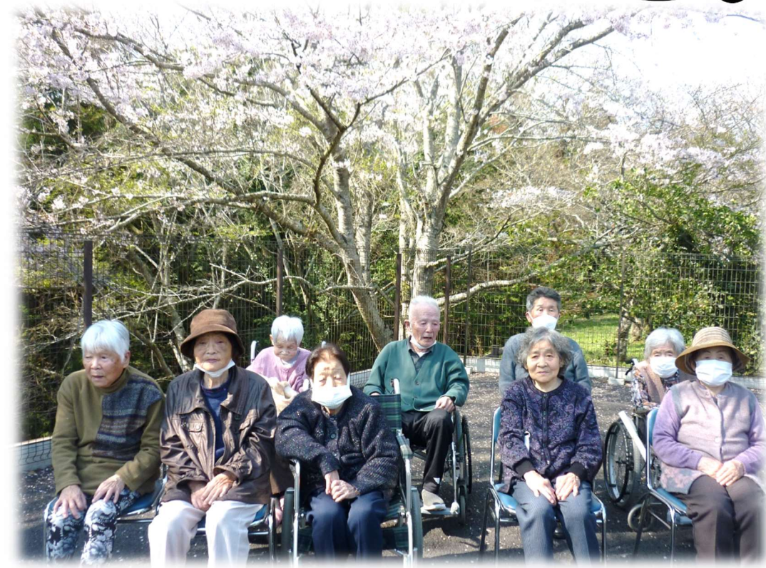
あゆみの駐車場でお花見をしました。