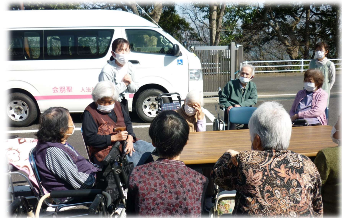
【防災訓練】 駐車場に避難しました